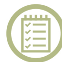
回饋與輔導 定期輔導與關懷